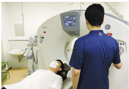
●CT検査(コンピュータ断層撮影)

X線を使って体の断面を撮影する検査。心臓・肺・大動脈などの胸部、肝臓・腎臓などの腹部、脳出血の有無などの頭部、整形分野における骨折の有無など、様々な病変の検査に利用されます。