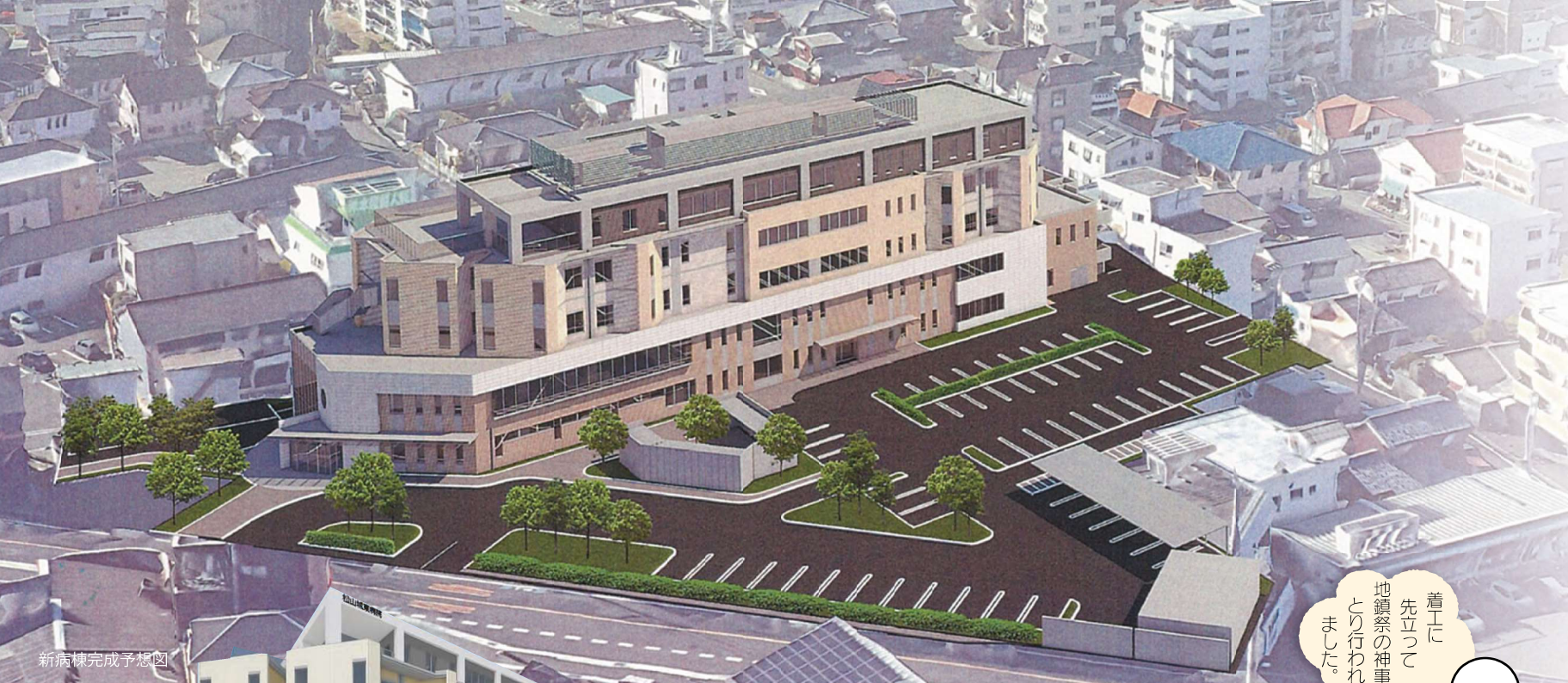
新病棟完成予想図