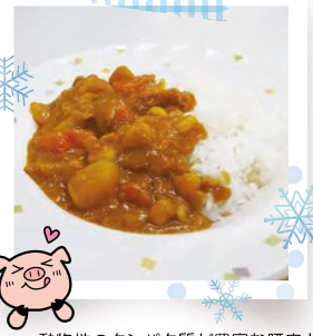
動物性のタンパク質が豊富な豚肉と畑の肉と言われる大豆入り