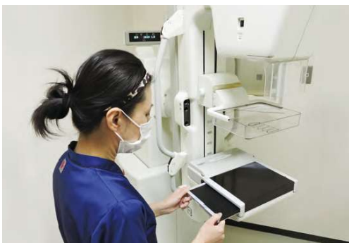
●乳房X線検査(マンモグラフィ)

X線を使って体の断面を撮影する検査。心臓・肺・大動脈などの胸部、肝臓・腎臓などの腹部、脳出血の有無などの頭部、整形分野における骨折の有無など、様々な病変の検査に利用されます。