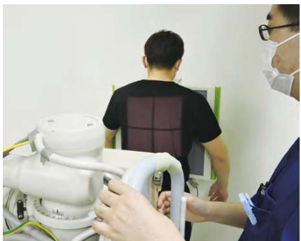
●単純X線検査(レントゲン撮影)