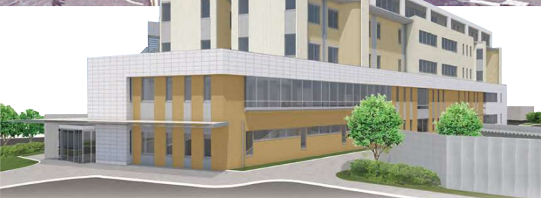
新病棟完成予想図