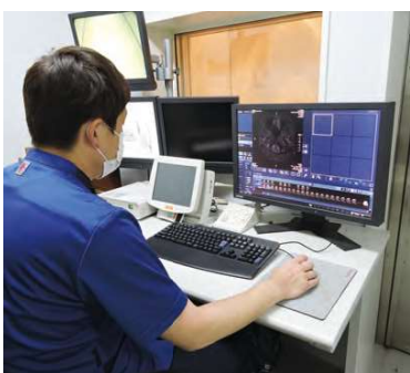
●MRI検査(核磁気共鳴像法)

乳がんは日本人女性がかっとも多くなるがんとしており、乳がんの患者数は年々増加傾向にあります。マンモグラフィ検査は乳がんの早期発見に有効な検査の一つになっています。