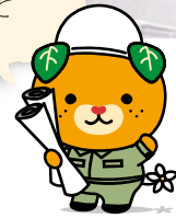
愛媛県イメージアップキャラクター みぎやん 許諾番号:212010